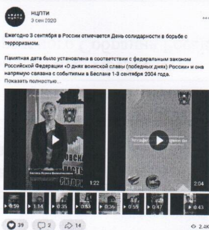
Рисунок 1 – Пример видеороликов

Особенность: студентам, намеренным принять участие в акции, следует представить технические (хронометраж — не более трех минут) и смысловые требования к создаваемому контенту (отсутствие сцен жестокости и насилия) (см. рисунок 2).